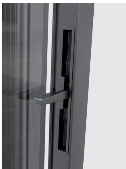
APERTURA BATTENTE CASEMENT OPENING