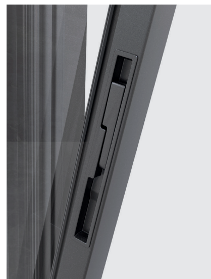
APERTURA RIBALTA TILT OPENING