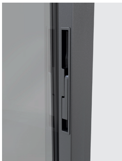
POSIZIONE DI CHIUSURA CLOSING POSITION